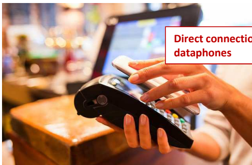
Direct connection to dataphones