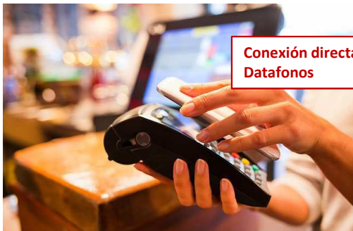
Conexión directa a Datafonos